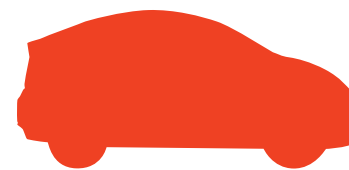
TABLE DE CONCERTATION SUR L'ENVIRONNEMENT ET LES VÉHICULES ROUTIERS

Forum de concertation pour tous les enjeux environnementaux liés à l'automobile, la Table coordonne, entre autres, le programme de reconnaissance Clé verte. Ce programme est consacré aux propriétaires garagistes qui respectent non seulement les normes exigées par la réglementation en vigueur mais qui mettent aussi en œuvre les bonnes pratiques environnementales assurant une gestion optimale des activités de leurs ateliers automobiles.