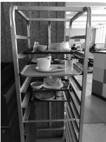
Étagères à cabarets et vaisselle sale

Un employé de la laverie (convoyeur et plonge) est responsable du tri du contenu des cabarets et/ou de la vaisselle laissée par les clients. Il reçoit de la formation à cet effet. Cet employé est également responsable du compost, du recyclage et des déchets. Du côté des clients, il est clairement indiqué qu'ils doivent tout laisser en place. Faire le tri à l'interne est une norme chez Sodexo qui permet de gagner du temps et qui est considérée comme un service à la clientèle. Le tri est plus efficace ainsi, tout comme la gestion des matières résiduelles et la qualité qui s'en suit.