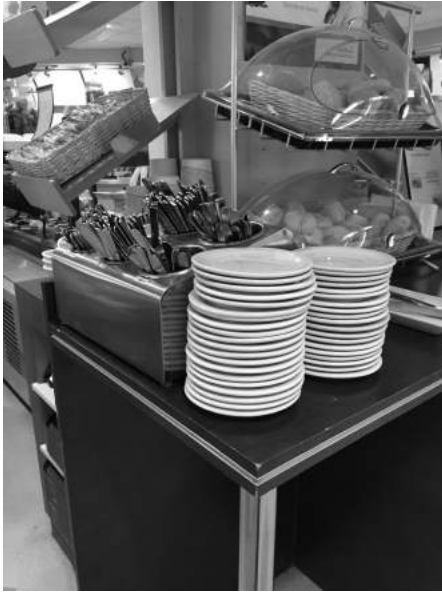
Offre de vaisselle durable