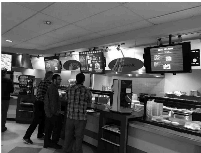
Écrans de présentation

Une autre mesure à souligner; la présence de distributrices de sucre et de lait dans les aires de service, évitant ainsi les emballages et le gaspillage.