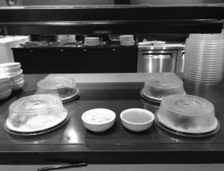
Cloches de service

En plus de l'offre de tasses de porcelaine et de plastique, 20 à 25 % des clients apportent leur propre tasse. Le breuvage est facturé au client selon le volume approximatif contenu dans la tasse.