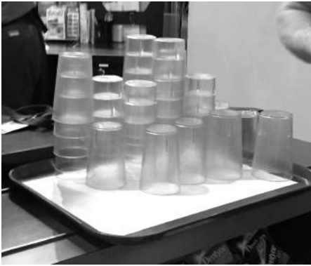
Verres de plastique réutilisables