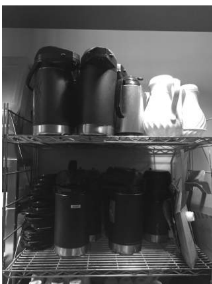
Équipements de service

Le service traiteur de Sodexo favorise également la réduction à la source. Son service café inclut systématiquement de la vaisselle et des cuillères durables, du lait et du sucre en vrac. Les buffets, boîtes à lunch et autres commandes sont également offerts en favorisant la vaisselle durable, mais dépendent aussi des besoins des clients.