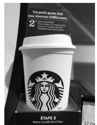
Verre à café réutilisable Starbucks