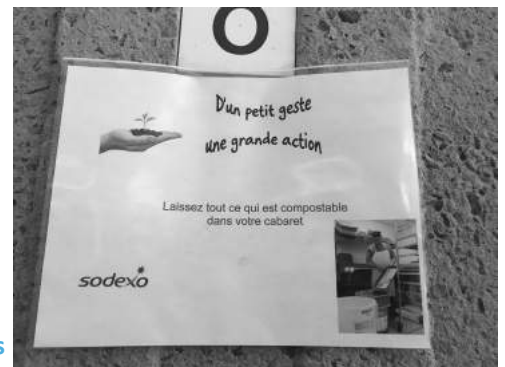
Instructions aux clients