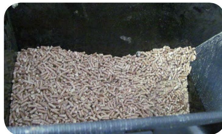
Granules de bois

Bien géré, le composteur JK5100 réussit à faire du compost sans odeur nuisible.