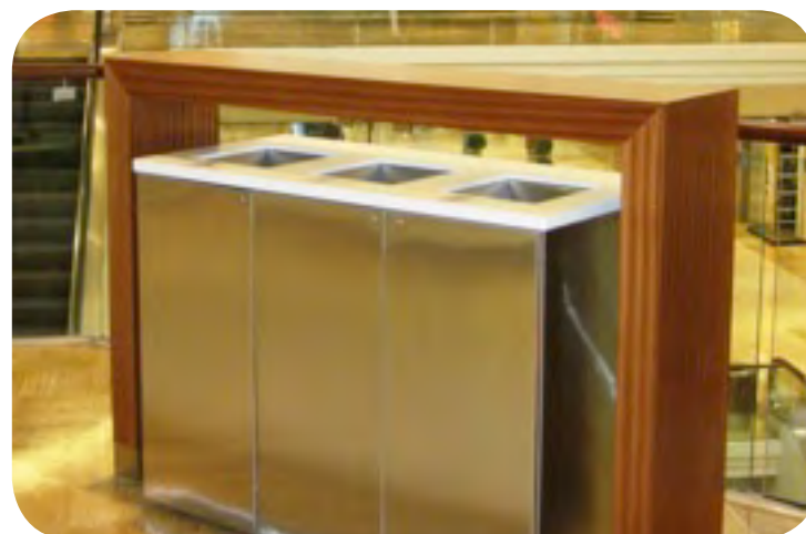
Îlots de récupération aux aires de restauration