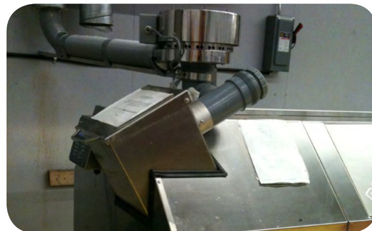
Capture de l'air vicié dans le composteur

La connexion de ventilation pour l'évacuation des gaz et des odeurs est reliée directement au système de ventilation à pression négative situé dans la salle. L'air est évacué à l'extérieur de l'édifice. Il n'y a aucune résidence à proximité.