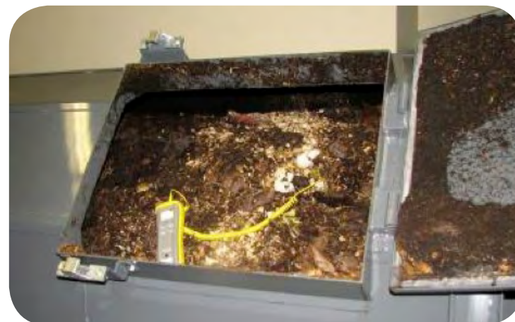
Composteur avec porte d'alimentation ouverte