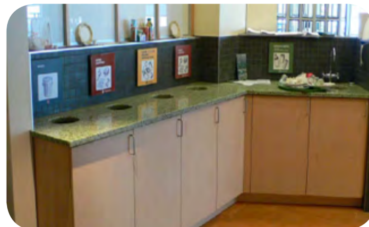
Cafétéria et tri des matières