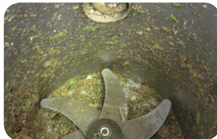
Trémie d'alimentation