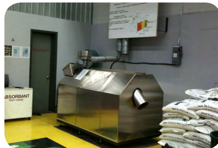
Composteur T60