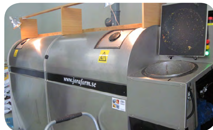
Composteur JK5100

Journal www.valléedurichelieuexpress.ca 31 août 2011