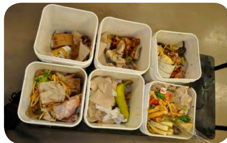
Bacs de collecte

À l'ÉTS, les opérations de compostage sont bien réalisées. L'opérateur du système est rigoureux dans le maintien du ratio entre les matières compostables et la source de carbone, ce qui prévient les mauvaises odeurs. Une hotte a été mise en place, à titre de prévention, à une extrémité du composteur et une entrée d'air forcée a été installée à l'autre extrémité. Cette hotte est rattachée au système de ventilation de la cuisine de la cafétéria. De plus, le risque de génération d'odeurs est faible dans la mesure où le système ne traite que des végétaux et qu'il est exploité selon des conditions optimales de compostage.