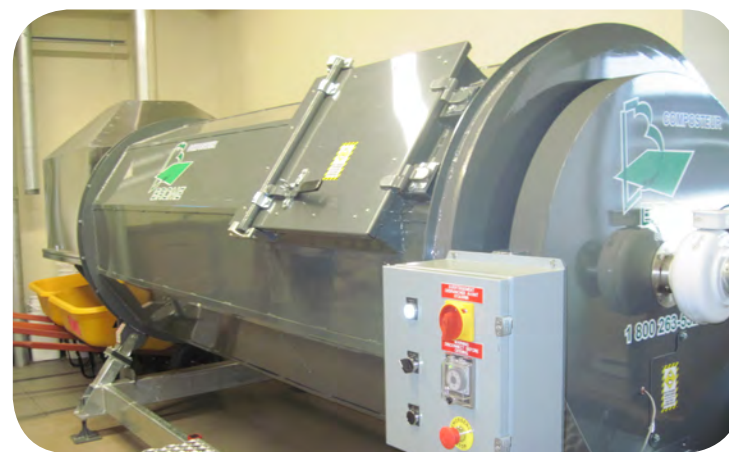
Composteur industriel AGF-BROME