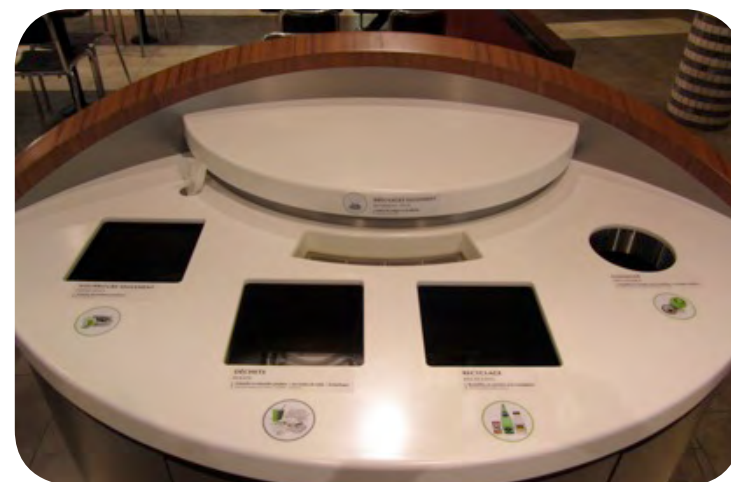
Îlot de récupération à cinq ouvertures aux aires de restauration