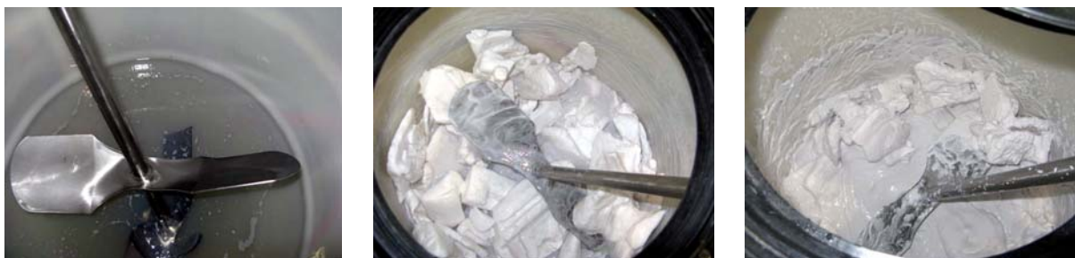
■ Figure 9 – Évolution de la dissolution du polystyrène