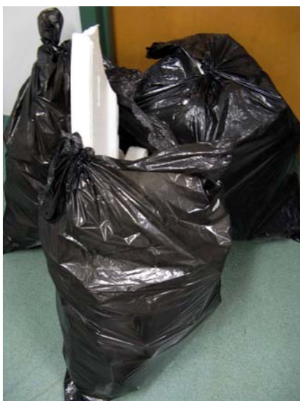
■ Figure 7 – Polystyrène utilisé

centre. Vu la grande variété de types de PS recueillis et la courte durée de l'essai, il a été convenu d'utiliser surtout le PS expansé, celui qui possède la vitesse de dissolution la plus rapide. Pour les fins de la démonstration sur site, le polystyrène a été trié du reste des rejets pendant quelques heures. Ainsi, deux sacs de gros morceaux ont été ramassés en 45 minutes au pré-tri et un sac et demi de petits morceaux ont été recueillis durant la matinée sur la ligne de tri. Des photos de ces sacs sont présentées à la figure 7. Le polystyrène a été ajouté par volumes d'environ 5 gallons (20 litres). La figure 8 présente des images du remplissage et du démarrage de l'unité. La masse totale de polystyrène ajoutée est de 3,89 kg, soit trois gros sacs de grands morceaux et un gros sac de pièces plus petites (voir la figure 8). Notons que l'agitation était continue.