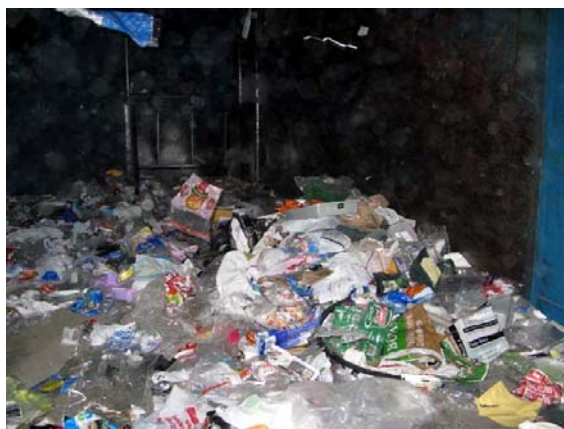
b) Matières rejetées

Au début de l'essai, un volume initial d'environ 15 gallons (60 litres) de solvant a été ajouté au réservoir de polyéthylène haute densité. L'emplacement du poste de collecte n'étant pas à proximité des lignes de tri, le polystyrène a été acheminé dans des sacs par un employé du