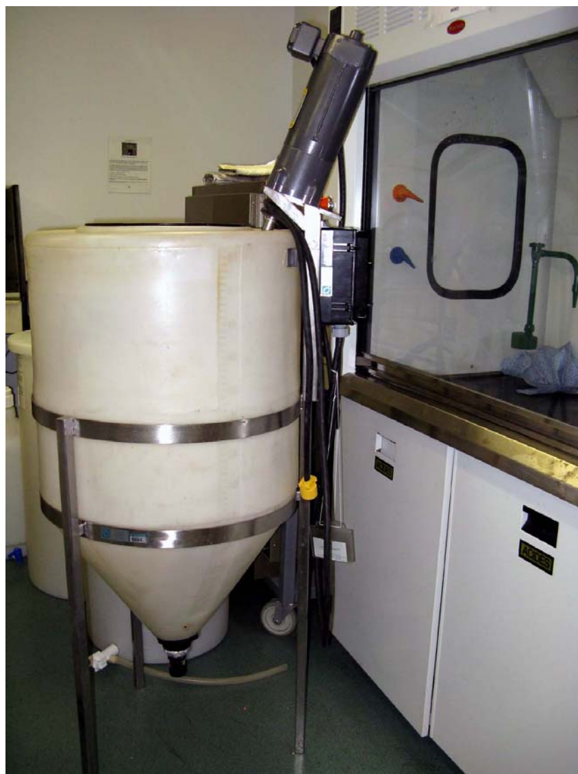
■ Figure 4 – Réservoir utilisé comme poste de collecte

Beaucoup de points étant remis en question, il a été décidé de ne pas pousser plus loin la conception de ce prototype et d'opter plutôt pour du matériel commercialement disponible qui pourrait faire office de poste de collecte le temps des essais. Le CTTÉI s'est donc procuré un réservoir conique en polyéthylène haute densité d'une capacité de 55 gallons (220 litres) muni d'un agitateur motorisé à quatre pales. Cet équipement est illustré aux figures 4 et 5. Notons que l'utilisation sécuritaire d'un agitateur électrique est confirmée dû à la classification SIMDUT B3 du solvant.