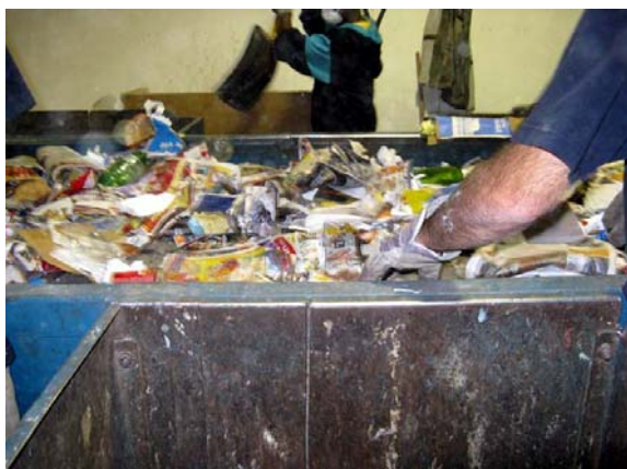
a) Ligne de tri